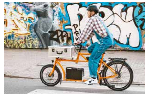
*Zuladung berechnet mit einem Fahrergewicht von 80 kg.

Rahmengrösse(n): Einheitsgrösse Gesamtlänge: ab 217 cm Maximale Zuladung Ladefläche*: 60 kg Eigengewicht: ab 26,5 kg Preis: ab Fr. 3990.- schoof-jensen.de