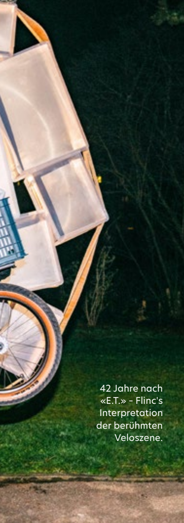
42 Jahre nach «E.T.» - Finc's Interpretation der berühmten Veloszene.

« Finc ist ein Generationen-fahrrad, das für Gross und Klein geeignet ist und über Jahrzehnte genutzt werden kann. »