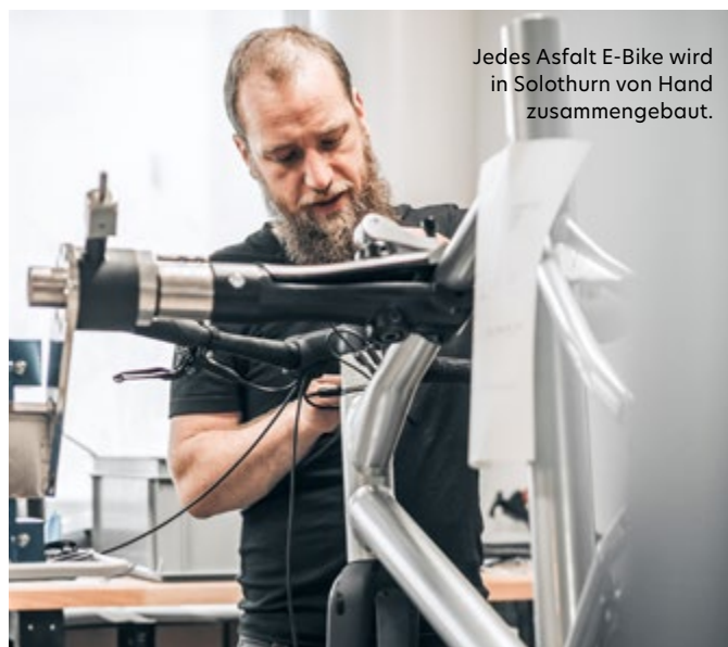
Jedes Asphalt E-Bike wird in Solothurn von Hand zusammengebaut.